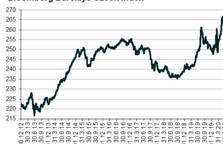
Bloomberg Barclays Czech Index

Koncem dubna byly desetileté výnosy na úrovni 1,3% (počátkem ledna 2020 dokonce na 1,6%), koncem května však poklesly pod 0,8%, a to jako důsledek snížení sazeb ČNB. Během června se už nic dalšího nestalo, nepřekvapí tedy, že dlouhý konec se koncem června nacházel jen o malinko výš (0,81%) než koncem měsíce předcházejícího. Sentimentu na trhu udávaly tón primární aukce Ministerstva financí, jež byly tak jako v celém druhém kvartálu provázeny vysokým zájmem zejména domácích ale i zahraničních investorů. V červnu přitom již MF snížilo nabízené objemy, což zlepšilo aukční výsledky a pomáhalo cenám na sekundárním trhu.