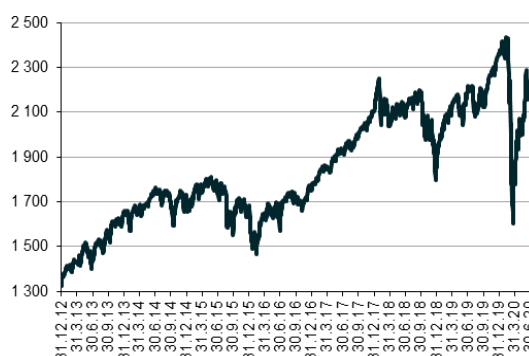
MSCI World Index

dalších čtvrtletí a dobré hospodářské výsledky společností za druhé čtvrtletí jsou nadále podporou akciovým trhům. V USA zahájená sezóna hospodářských výsledků průběžně vyznívá velice dobře a zvláště na úrovni čistých zisků došlo k dvoucifernému překonání odhadů analytiků u všech sektorů. Na tržbách zaostaly sektory ropy a plynu, těžby a utilities, výrazné pozitivní překvapení předvedl sektor průmyslu, spotřebitelský, zdravotnictví, telekomů a technologií. Ve výsledku si nejširší globální akciový index MSCI All Country World připsal zhodnocení 5,1 %, v průměru opět vybočovala kladná výkonnost amerických technologických firem jako Amazon, Apple, Facebook nebo Google, americký index S&P 500 meziměsíčně vzrostl o 5,5 %, evropský index DJ STOXX 600 klesl -1,1 % a japonský index Nikkei 225 o -2,6 %.